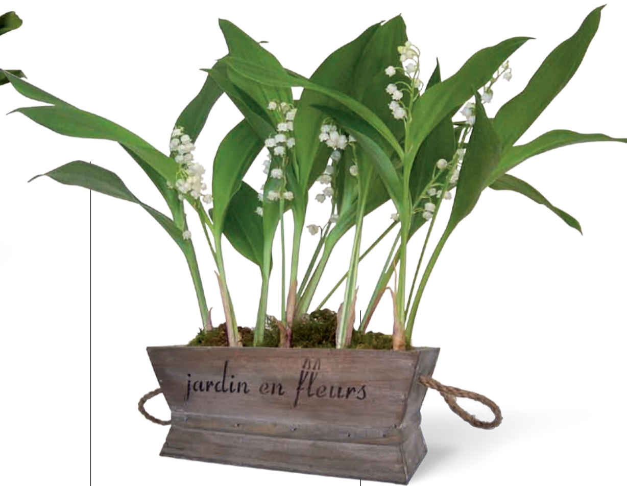
JARDINIÈRE "JARDIN EN FLEURS" 6 griffes 19 x 11 x 8 cm • Réf 67