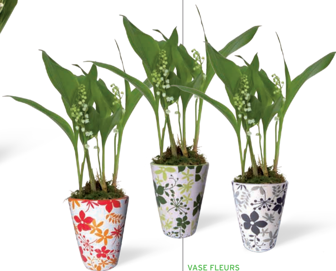
VASE FLEURS ORANGE, VERT OU GRIS 3 griffes • Réf 59