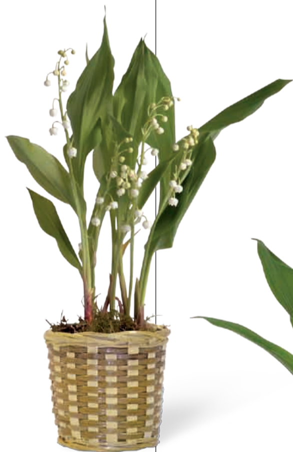
CACHE-POT OSIER 3 griffes • Réf 60