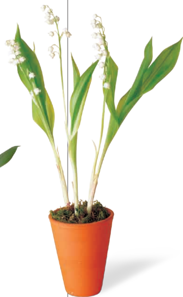
POT DE TERRE CUITE 3 griffes 1 er choix Réf 71