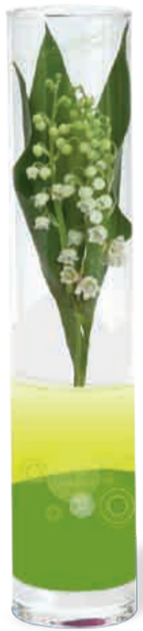
TUBE VERRE 3 BRINS 27 cm • Réf 66