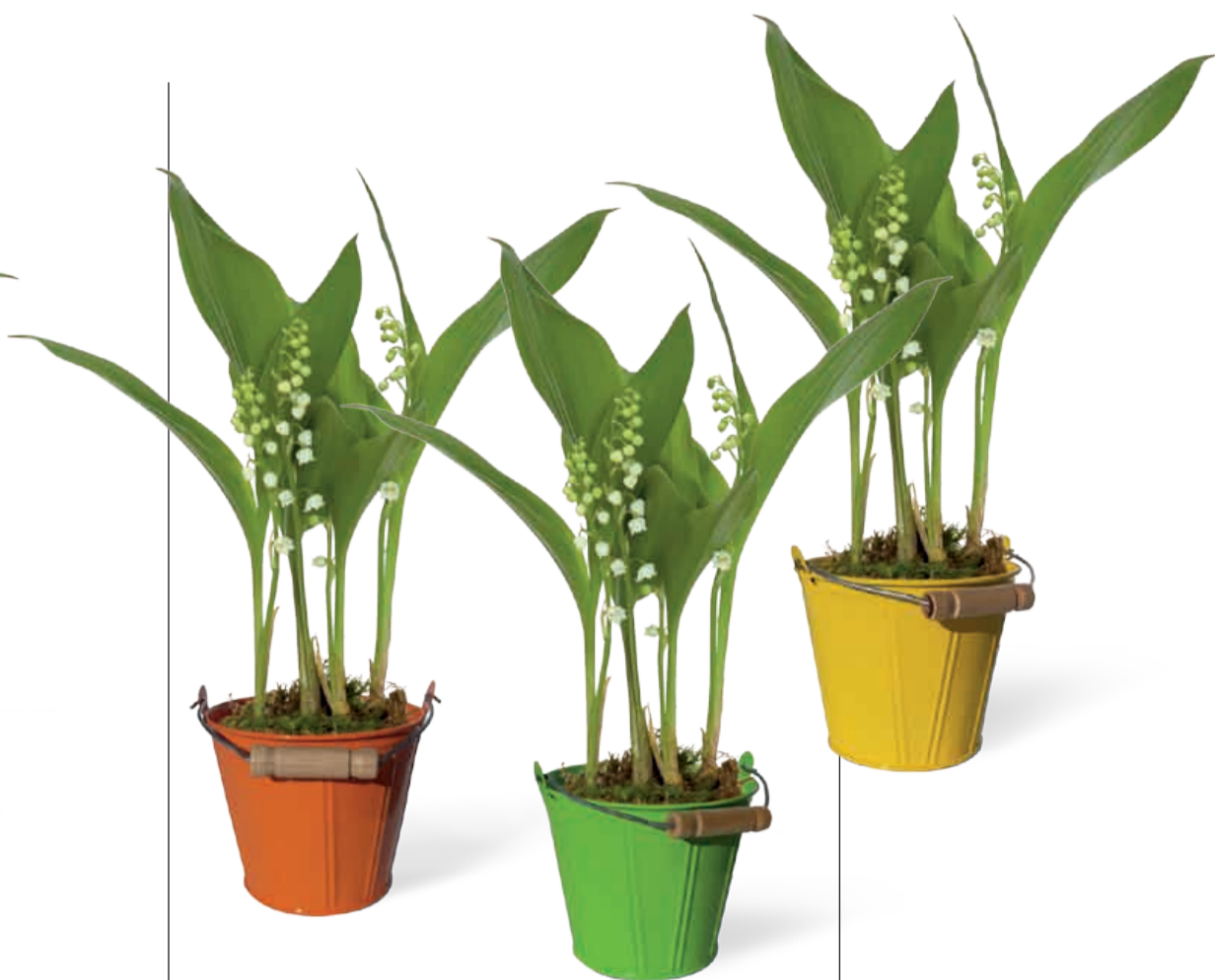
POT ZINC ÉMAILLÉ 3 COULEURS 3 griffes Diamètre 11 cm • Réf 58