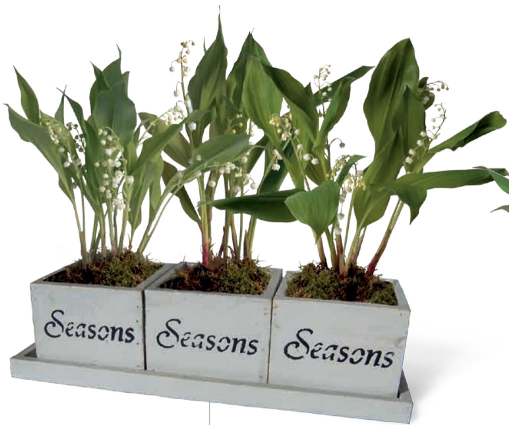
ENSEMBLE TRIO SEASONS 3 x 3 griffes 35 x 13 x 9 cm • Réf 629