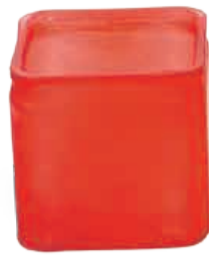
BOUQUET BULLE AVEC CUBE DÉCOR ASSORTI