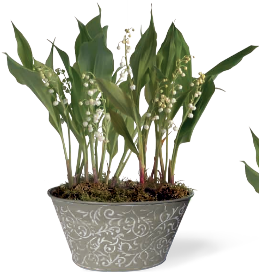
JARDINIÈRE OVALE ZINC 6 griffes 19 x 13 x 10 cm • Réf 56