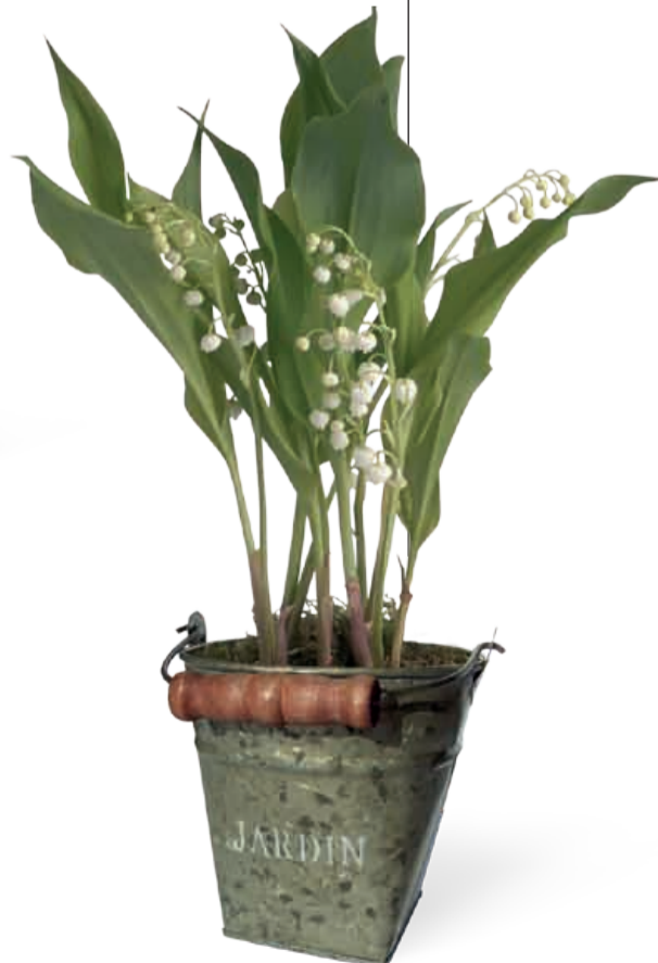
POT ZINC CUIVRÉ 4 griffes Diamètre 12 cm • Réf 52