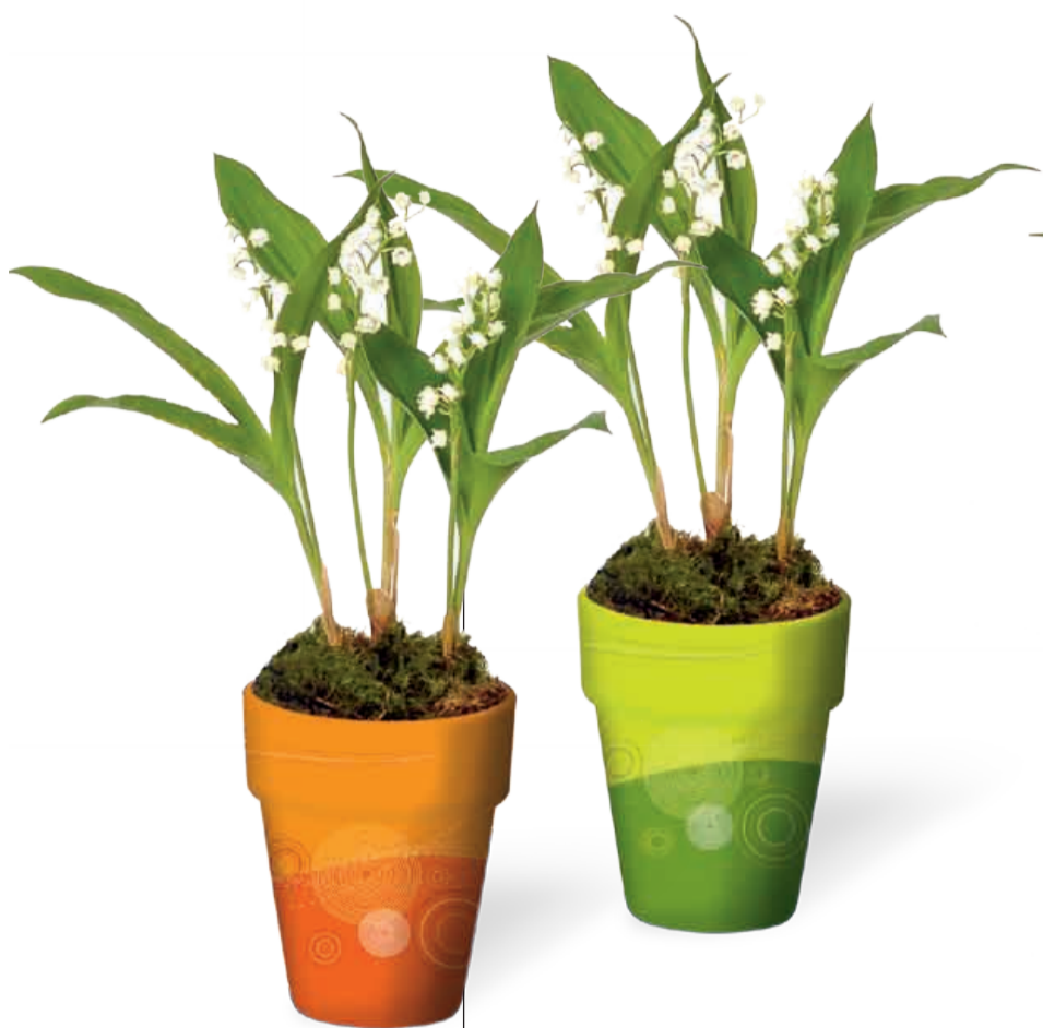
POT DÉCOR 4 griffes Diamètre 11 cm • Réf 65