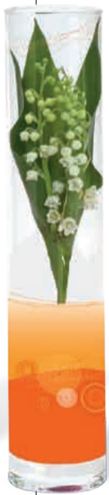
TUBE VERRE 3 BRINS 36 cm • Réf 54