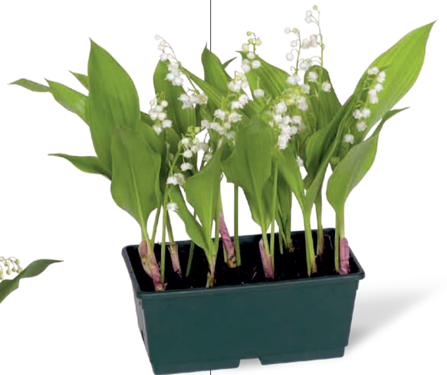
JARDINIÈRE PLASTIQUE VERTE 8/10 griffes • Réf. 55